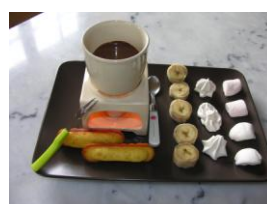
Petite fondue au chocolat