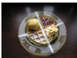
Gaufre quatre saisons