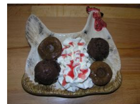
Baba du bougnat

DECouvrez AUSSI NOS CAFES, THES ET CHOCOLATS GOURMANDS !